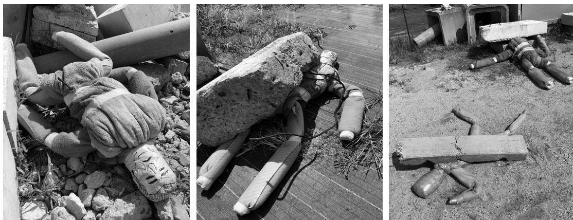
写真22（交通事故対応救助訓練）