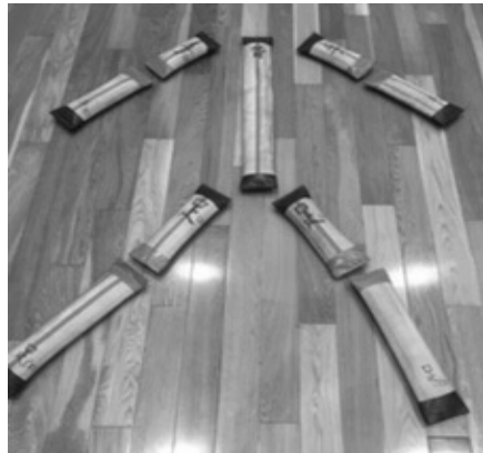
写真3（毛布の割り振り）