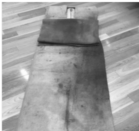
写真8（胴体の作成方法③）