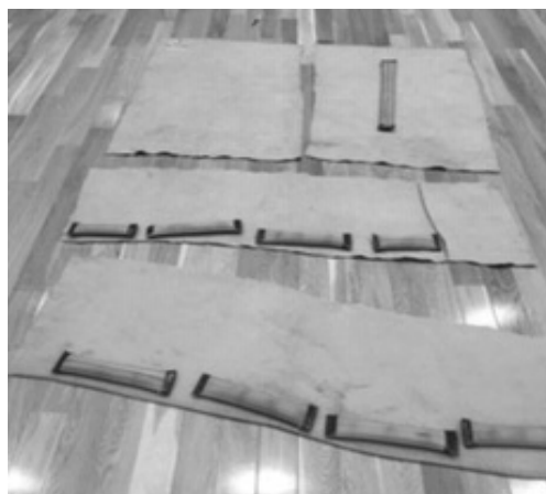
写真15 (上肢・下肢の作成)

毛布を4分割に切断します。上肢用の毛布は、下肢用に比べて短く設定するため、適量を切断します。