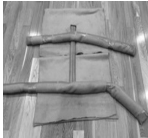
写真17 (胴体の作成方法②)

2枚の胴体用毛布を一部重ね合わせ、背骨となる消防ホースを中央部に置きます。その後に、上下とも折り返し、頭部及び臀部を形成していき、要所をガムテープで固定します。