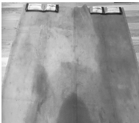
写真5（下肢の作成方法）

1番小さい毛布の上部に上肢用の消防ホースを配置し、消防ホースに巻きつけるように毛布を巻いていきます。