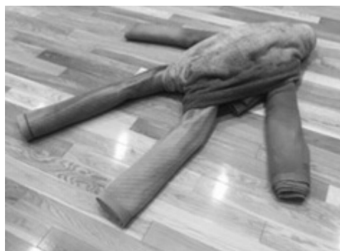
写真11（ガムテープで固定）