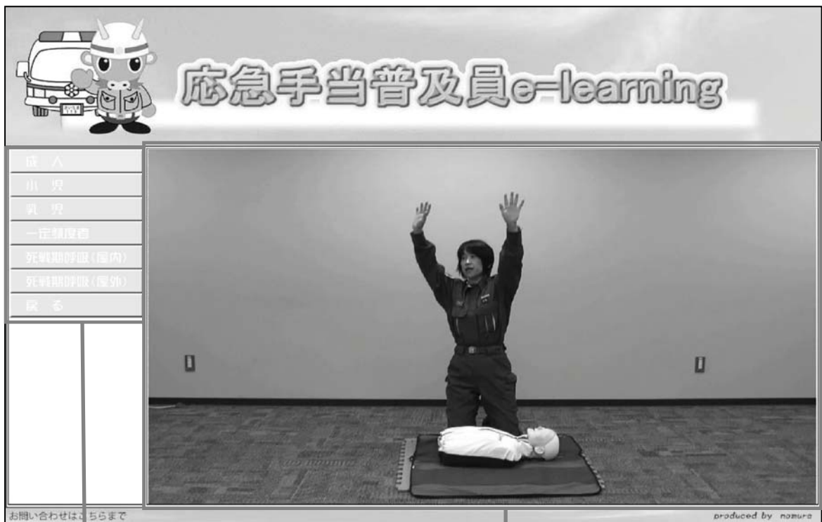
各種項目のコンテンツ